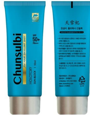
天雪妃 ホロトキシ サンブロック Chunsulbi HOLOTOXY Sun Block 50ml

Dual functional cosmetics containing Jeju Mayu and red sea cucumber extract (whitening / wrinkle improvement)