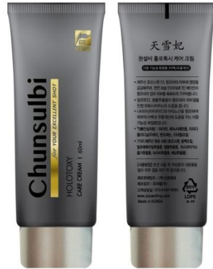
天雪妃 ホロトキシ ケアクリーム Chunsulbi HOLOTOXY Care Cream 60ml