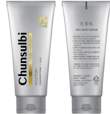
天雪妃 ホロトキシ クレンジングフォーム Chunsulbi HOLOTOXY Cleansing Foam 120ml

UV-block functional cosmetics that lightly penetrate skin without shine [SPF50 + PA +++]